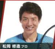
松岡 修造 プロ