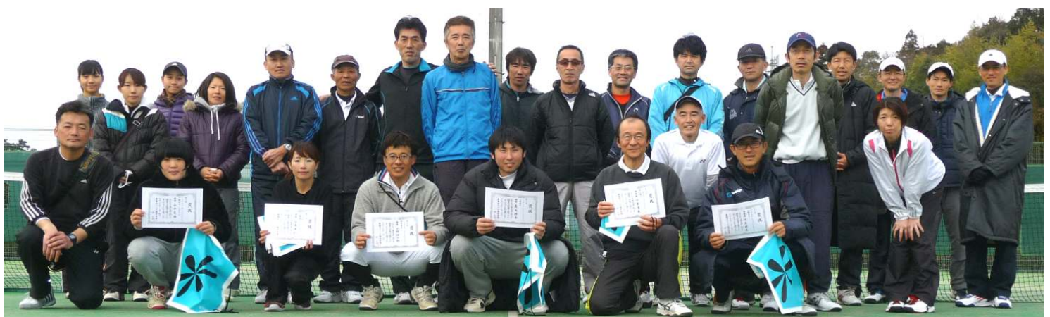
シングルスにチャレンジした選手と、運営にお世話になった協会指導部の皆さん